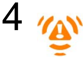
Alarmen går efter 7,6 sek.