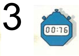
Folealarmen måler tiden.