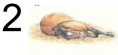
Hun lægger sig på siden