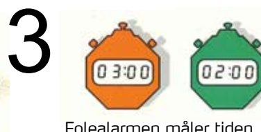
Folealarmen måler tiden. Går der over 3 minutter hviler hun sig, idet en pressevé højst varer 2,5 min. Går der mere end 7,6 sek. og mindre end 3 minutter til hun rejser sig igen, går alarmen.