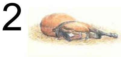
Hun lægger sig på siden