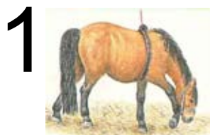
Hoppen skal fole

For hopper, der hviler normalt. Når presseveerne begynder, lægger hoppen sig fladt på siden for at presse optimalt. Folealarmen registrerer dette og alarmen aktiveres efter 7,6 sekunder. Én pressevé varer minimum 7 sekunder.