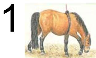
Hoppen skal fole